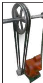
CON DOBLE BANDA Y POLEAS