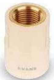
1/2" a 1"