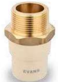
1 1/4" a 2"