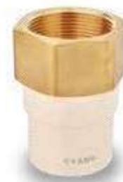
1 1/4" a 2"