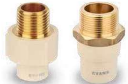
1/2" a 1"