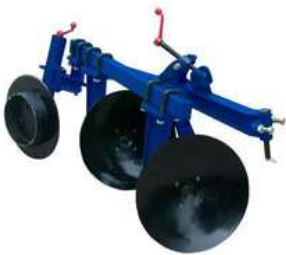
Arado de disco KRMC1800-1001