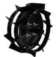
Rueda metálica TRU606