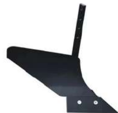
Surcador cuadrado RAM750-1003