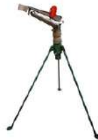
Cañón con tripié KRMC1800-1002