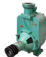
Bomba autocebante 3x3 con mangueras y base KRMC1800-1005