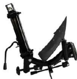
Surcador reversible TSR640