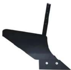
Surcador cuadrado TS641

Implementos adicionales *Se venden por separado