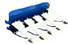
Segadora de tallos altos KRMC1800-1003