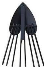
Cosechador de papas RAM750-1002