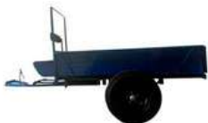
Remolque hidráulico KRMC1800-1004