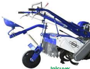
Incluye: Cultivador con asiento